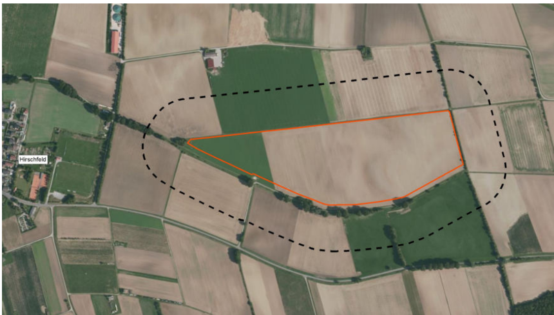
Abbildung 1: Flächenumgriff des Geltungsbereichs des Bebauungsplans (rot) und Unters- suchungsgebiet (schwarz gestrichelt), ohne Maßstab

Das Untersuchungsgebiet befindet sich ca. 100 m östlich von Hirschfeld im Bereich der Ackerlagen um den „Steinbühl“. Als UG werden die an die Planung angrenzenden Landschaftsausschnitte in einem Umgriff von ca. 120 m definiert. Es entspricht damit dem Wirkraum des Vorhabens auf die potenziell vorkommenden Arten und umfasst eine Fläche von ca. 42 ha.