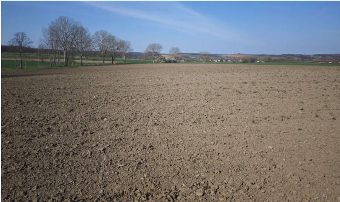
Abbildung 2: Ackerflächen mit Gehölzbeständen entlang des namenlosen Grabens; Blickrichtung Südwesten (K. Gees, 2025)

Die Höhenlage umfasst Werte zwischen 210 m NN im Nordosten und 230 m NN im Südwesten.